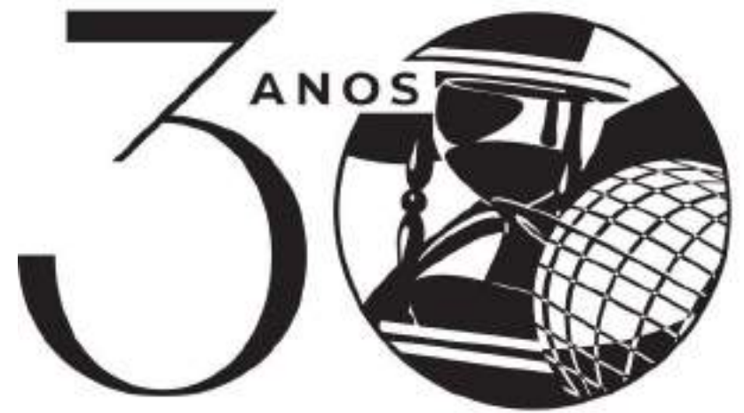
INSTITUTO HISTÓRICO E GEOGRÁFICO DE GETÚLIO VARGAS