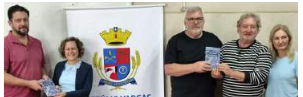
Exemplares foram entregues para a Smecc e para o Instituto Histórico