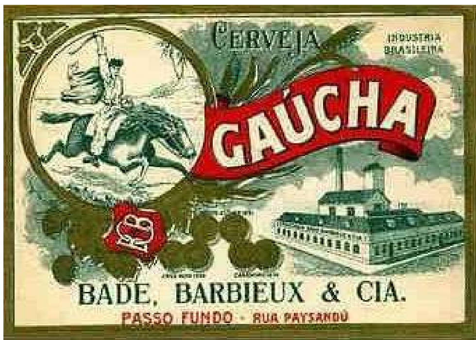
Rótulo da cerveja Gaúcha, de Passo Fundo

Como era comum na época, as garrafas de cervejas eram acondicionadas em caixa de madeira e para o transporte mais longo o vasilhame era empalhado com palha de cevada. O grosso da produção de cervejas e refrigerantes da Serrana era realizado pela ferrovia. O complexo industrial foi adquirido pela Cervejaria Brahma, que também comprou a Continental, em Porto Alegre.