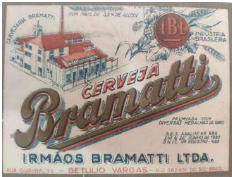
Rótulo da cerveja Bramatti & Filhos, de Getúlio Vargas