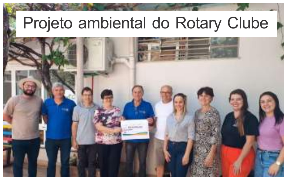
Projeto ambiental do Rotary Clube

O EC Cobra Preta, de Getúlio Vargas, comemora mais um aniversário reunindo seus associados num almoço neste domingo, dia 06.