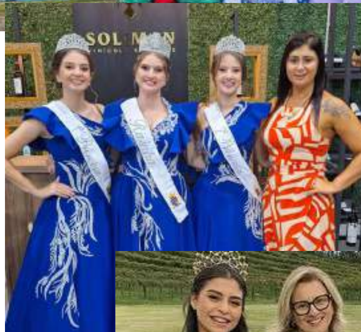
Ao lado, a corte de Getúlio Vargas; e abaixo, as princesas de Ipiranga do Sul; com suas acompanhantes no evento em Itatiba do Sul