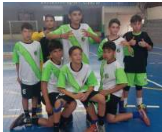
EEEF Érico Veríssimo futsal infantil masculino