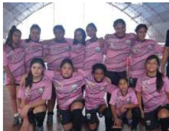
APAE futsal juvenil feminino