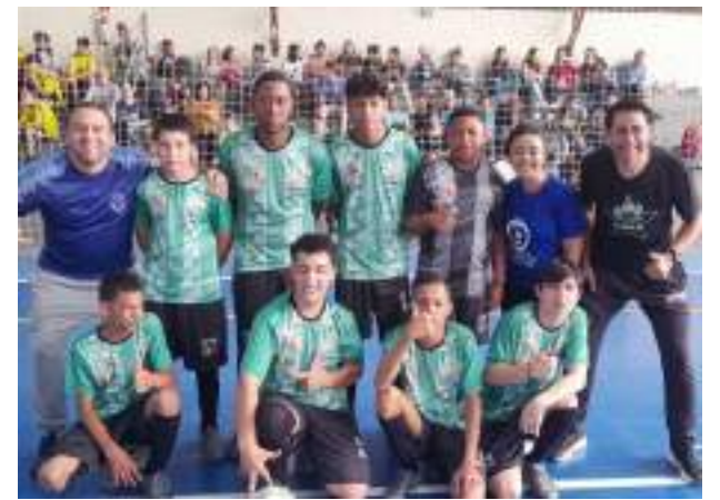
APAE futsal juvenil masculino