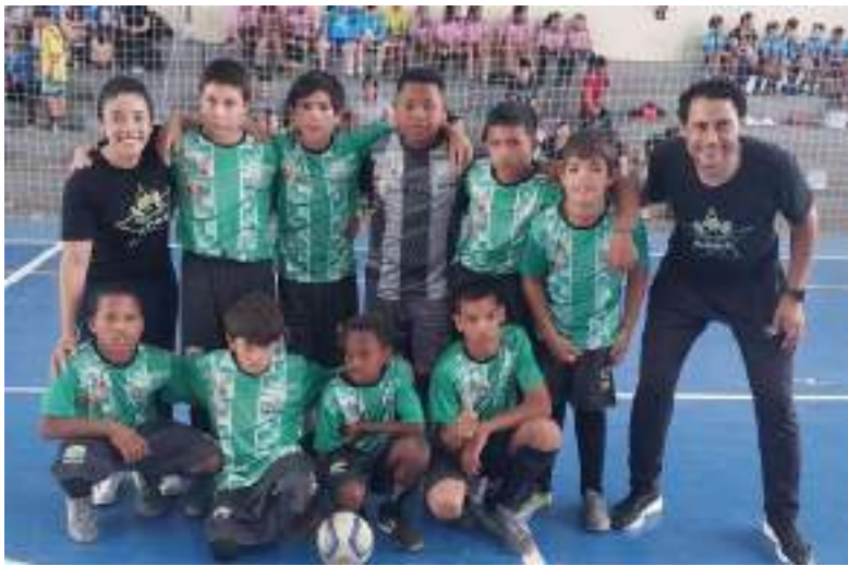
APAE futsal infantil masculino

• Arremessos - Arremesso de Peso (3kg) Feminino: EEEF Érico Veríssimo.