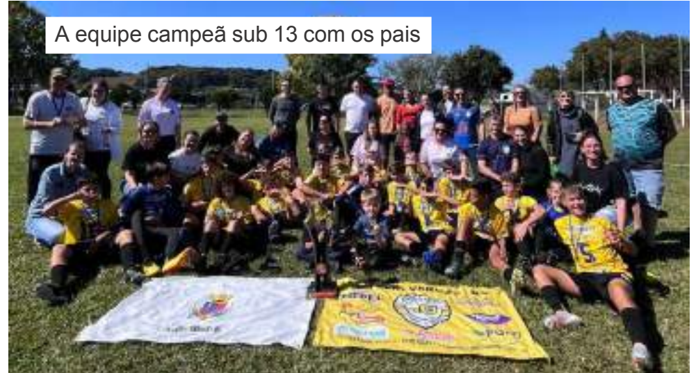
A equipe campeã sub 13 com os pais