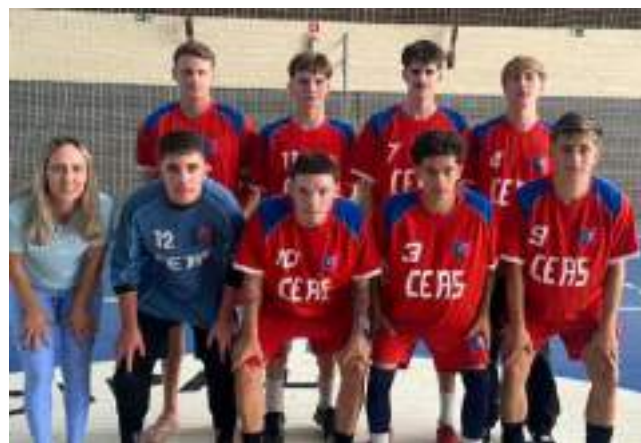
CEAS futsal juvenil masculino