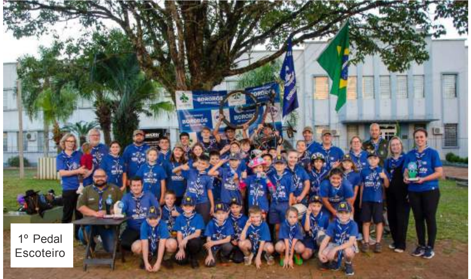
1º Pedal Escoteiro