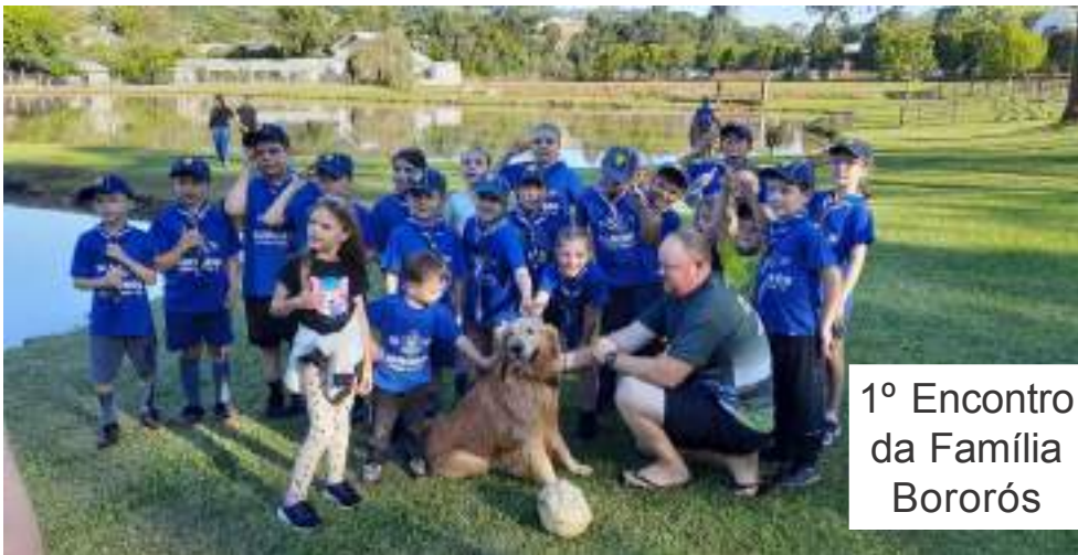
1º Encontro da Família Bororós

O Recanto do Rio Formiga, no Distrito de Souza Ramos, sediou o 1º Encontro da Família Bororós. A atividade de integração foi também ecológica, com a trilha guiada pelos proprietários do local, que integra o roteiro turístico Getúlio Vargas: Fé, Cultura e Tradição.