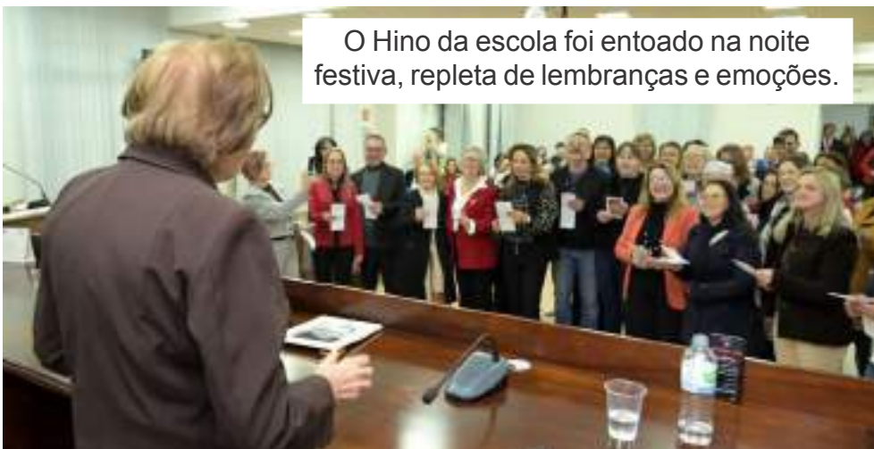
O Hino da escola foi entoado na noite festiva, repleta de lembranças e emoções.