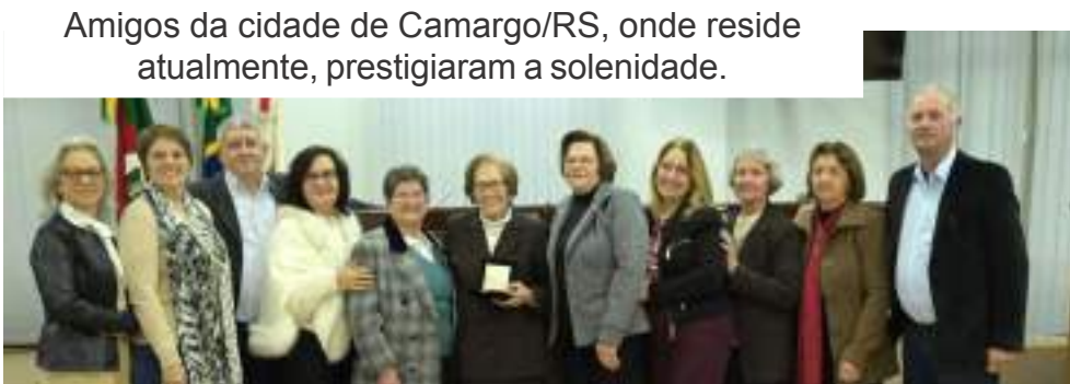
Amigos da cidade de Camargo/RS, onde reside atualmente, prestigiaram a solenidade.