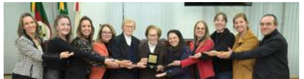
Ex-alunos da turma da 8ª série.