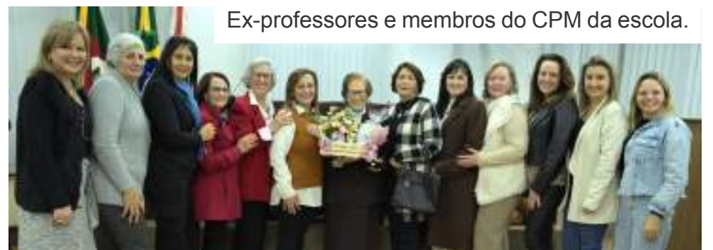
Ex-professores e membros do CPM da escola.