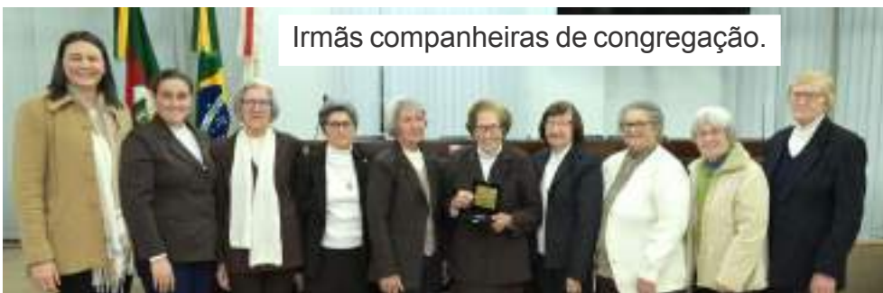
Irmãs companheiras de congregação.