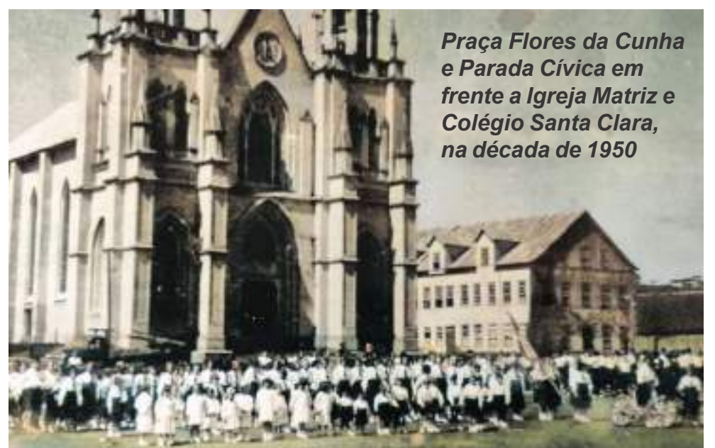
Praça Flores da Cunha e Parada Cívica em frente a Igreja Matriz e Colégio Santa Clara, na década de 1950

Diretores: Neivo Angelo Fabris (RP 10783 - DRT/RS) e Anissara Zir Redação e Comercial: Av. Borges de Medeiros, 1485 99900-000 - Getúlio Vargas - RS Editado por Neivo Angelo Fabris-ME - CNPJ 90.376.203/0001-70 - Inscr. Munic. 22.209