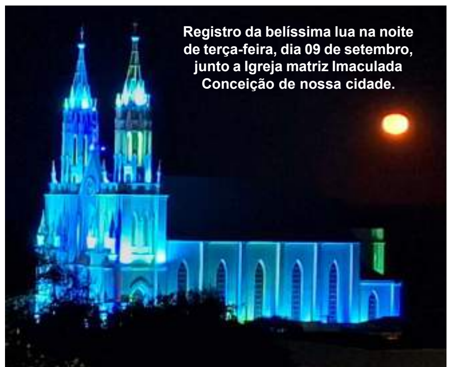
Registro da belíssima lua na noite de terça-feira, dia 09 de setembro, junto a Igreja matriz Imaculada Conceição de nossa cidade.