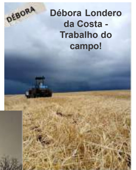
Débora Londero da Costa - Trabalho do campo!