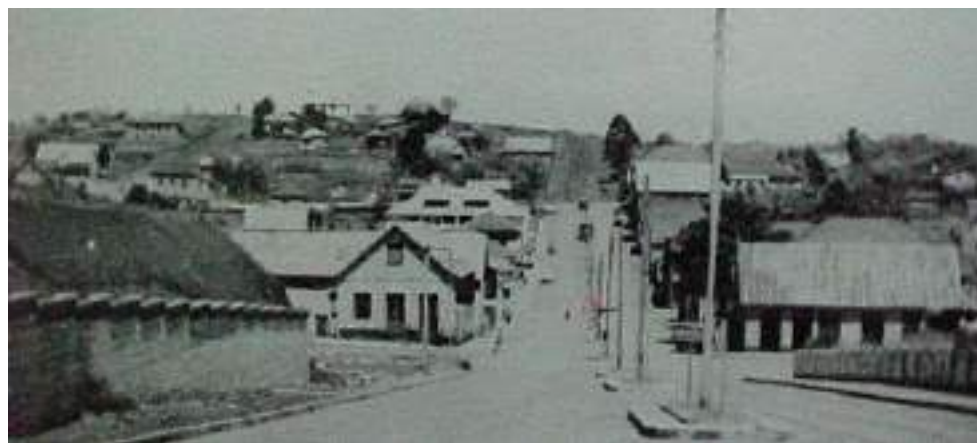
Rua Passo Fundo, atual Jacob Gremmelmaier

Diretores: Neivo Angelo Fabris (RP 10783 - DRT/RS) e Anissara Zir Redação e Comercial: Av. Borges de Medeiros, 1485 99900-000 - Getúlio Vargas - RS Editado por Neivo Angelo Fabris-ME - CNPJ 90.376.203/0001-70 - Inscr. Munic. 22.209