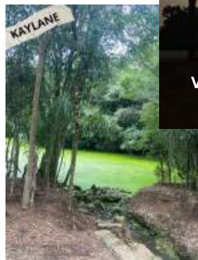
Kaylane Faccio - Raízes do tempo em Estação!