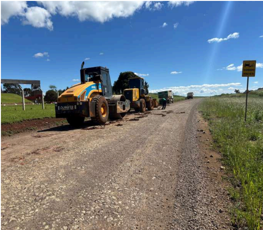
Máquinas atuam em trecho utilizado por moradores, produtores e empresas locais

Obras contemplam melhorias na mobilidade no tráfego da região