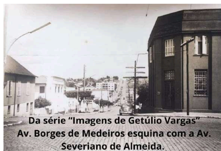
Da série “Imagens de Getúlio Vargas” Av. Borges de Medeiros esquina com a Av. Severiano de Almeida.