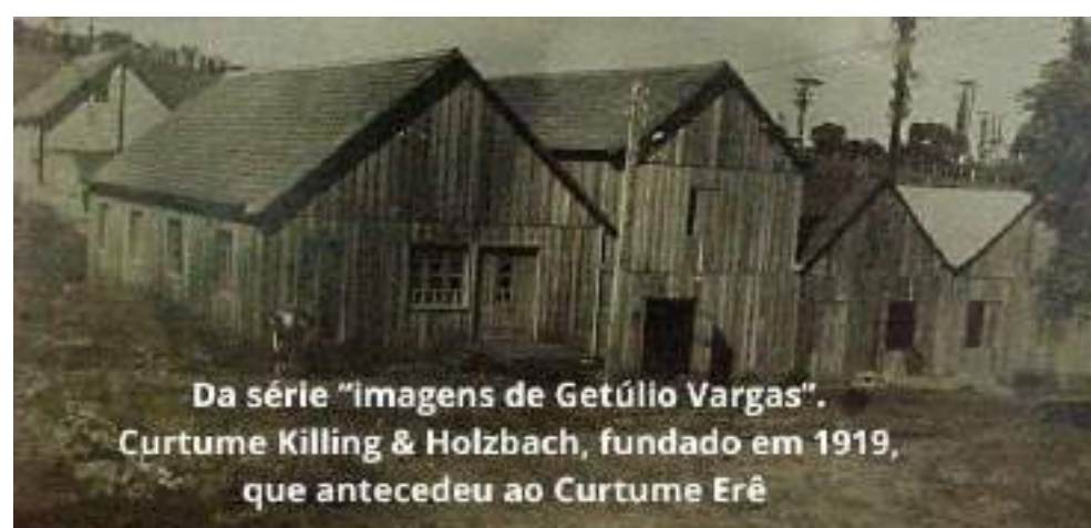
Da série "Imagens de Getúlio Vargas". Curtume Killing & Holzbach, fundado em 1919, que antecedeu ao Curtume Erê