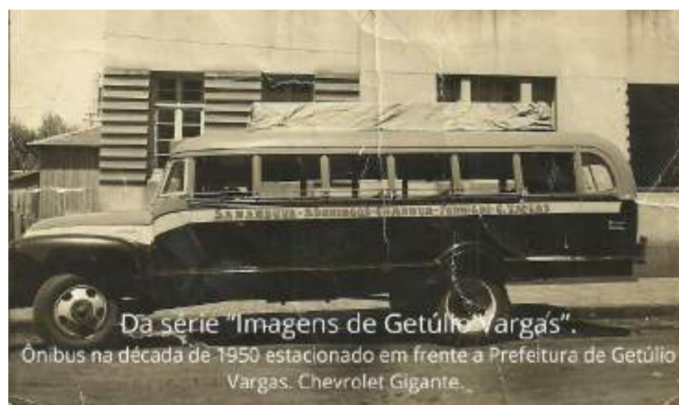
Da série “Imagens de Getúlio Vargas”.