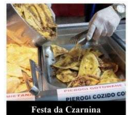
Festa da Czarnina

A Festa da Czarnina — uma das maiores e mais tradicionais festas da etnia polonesa do estado — está em sua 25ª edição e, a cada ano, a festa se torna ainda maior, servindo comida típica como a sopa da Czarnina, pierogi frito e cozido, saladas típicas, carne suína e uma variedade de doces poloneses.