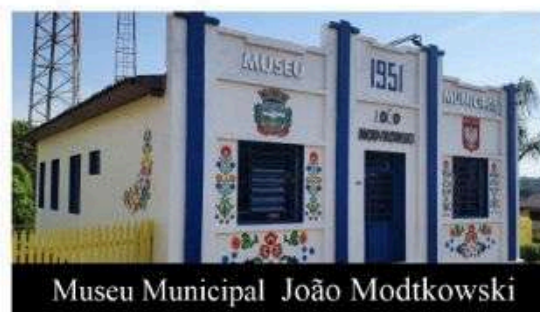
Museu Municipal João Modtkowski

Áurea busca preservar sua história e dos imigrantes colonizadores, e conta com o