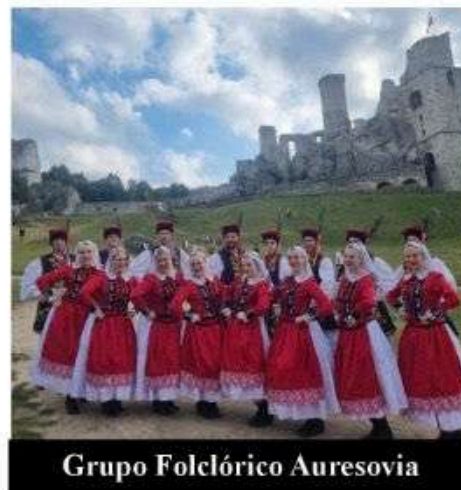
Grupo Folclórico Auresovia

O Grupo Folclórico Polonês Auresovia, com 95 anos de fundação, difunde a cultura polonesa através da dança, apresentando-se não somente no Brasil; o grupo já esteve em diversos países da América Latina e, recentemente, em 2024 na Polônia.