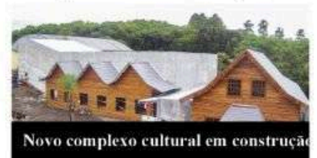
Novo complexo cultural em construção

A Braspol — que está construindo um grande complexo cultural que irá