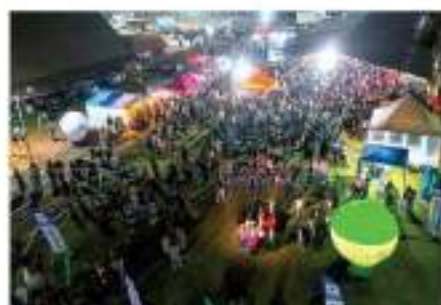
3º Encontro de Cervejeiros