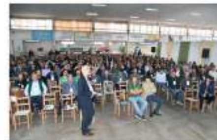
XII Fórum Norte Gaúcho do Trigo e do Milho