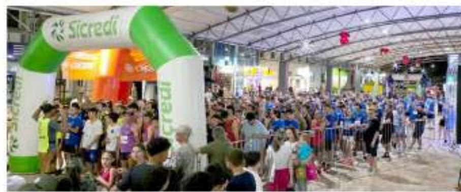
10ª Rústica de Getúlio Vargas