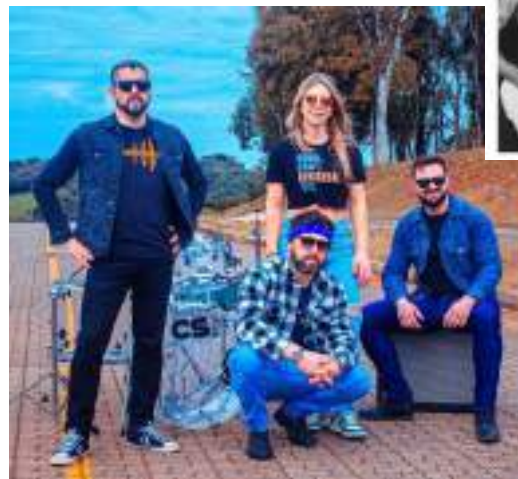
No sábado, dia 07 de março, às 19h30min, Banda Overtones; e às 20h15min, Good Fellas Band.