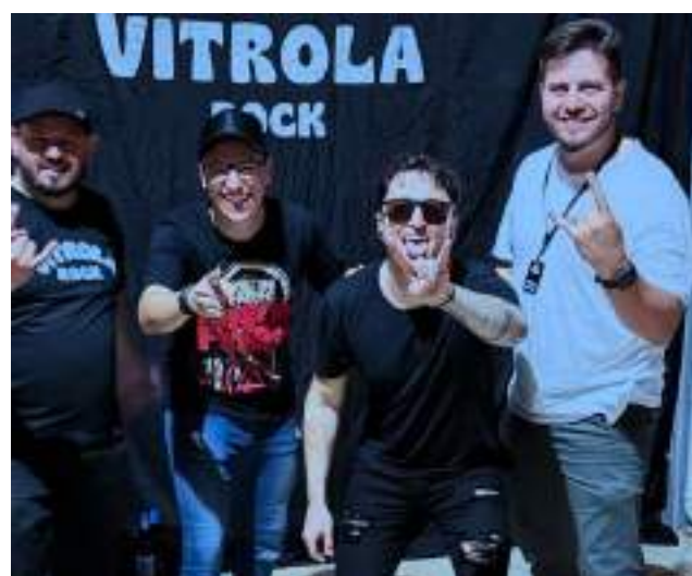
Banda Vitrola Rock às 16h30min do sábado.