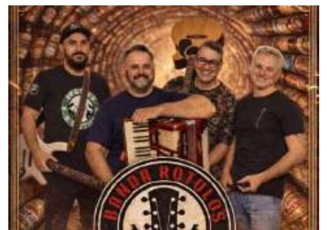
Banda Rótulos, também no sábado, às 18h.