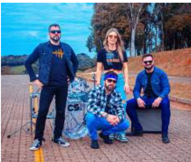
A banda Overtones, de Erechim, será a atração já na noite do sábado, às 19h30min.