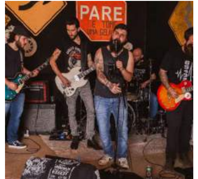
No sábado, dia 07, a banda Hard Division abre os shows do dia às 14h.