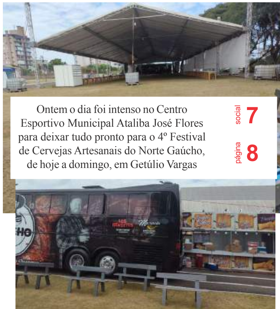
Ontem o dia foi intenso no Centro Esportivo Municipal Ataliba José Flores para deixar tudo pronto para o 4º Festival de Cervejas Artesanais do Norte Gaúcho, de hoje a domingo, em Getúlio Vargas