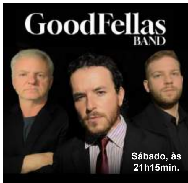
Sábado, às 21h15min.