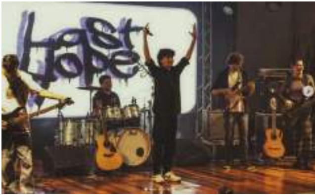
A programação de shows inicia com a banda Last Hope, nesta sexta-feira, dia 06 de março, às 18h30min.