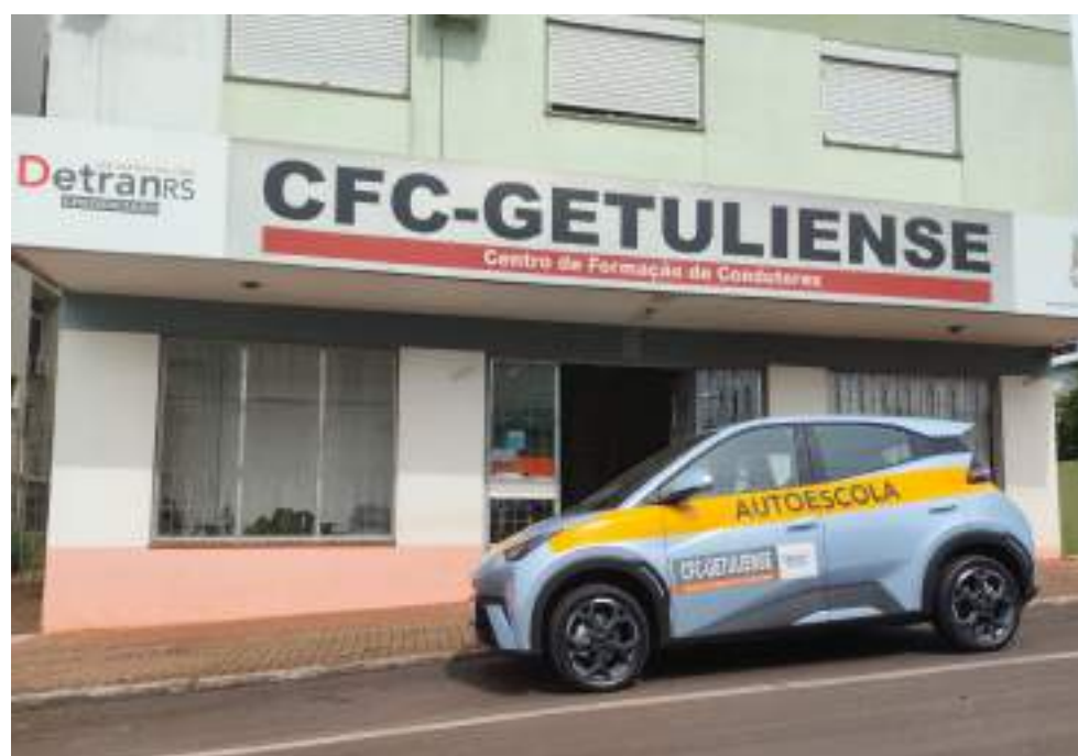
CFC Getuliense - Rua Dr. João Carlos Machado, 507 - Centro de Getúlio Vargas

Além da permanente modernização das instalações do CFC, localizado no número 507 da Rua Dr. João Carlos Machado, e também na qualificação dos professores e instrutores, a frota de automóveis, caminhões e ônibus, utilizados em aulas de direção, são atualizadas permanentemente. A mais recente aquisição foi