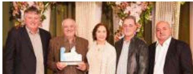
1º Artefatos de Concreto Schwanke Ltda