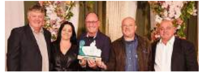
1º Polo Agrícola