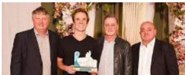
3º Frilar Industrial Ltda