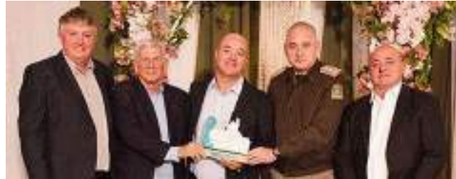
1º Sooro Renner Nutrição S/A