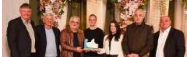
2º Alibem Alimentos S/A