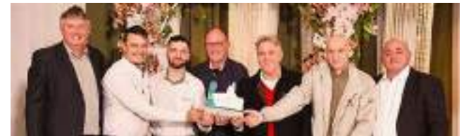
3º Cacil Comercial Agrícola Ciro Ltda