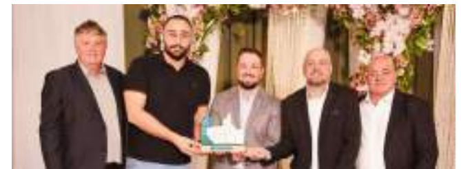
2º Hawk Tactical