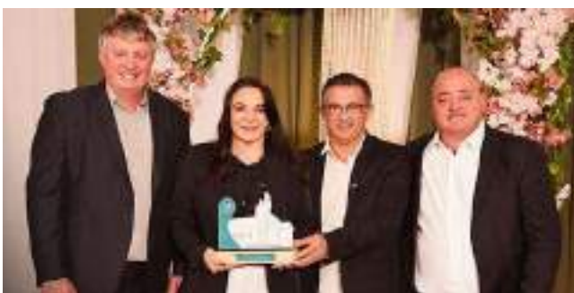
2º Rio Grande Tecnologia