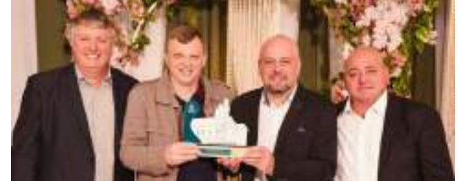
3º Ricardo Zancanaro Comércio de Bazar Ltda