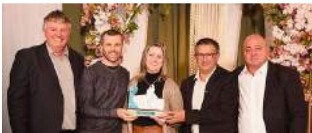
1º LPS Laboratório