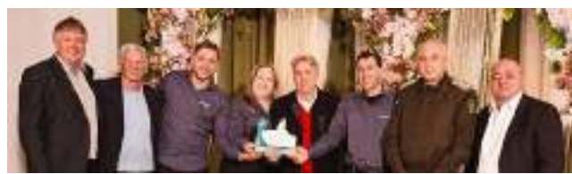
3º Mepel Máquinas e Equipamentos Ltda