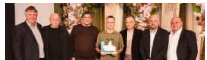
1º Sulpesca Macro Atacado Ltda