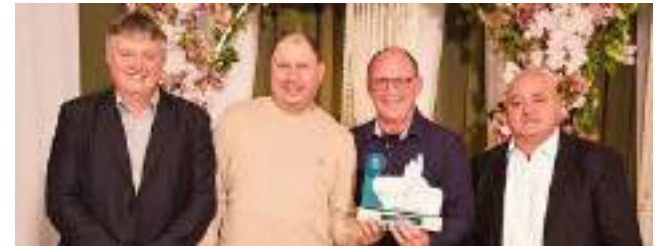
2º Oleoplan S/A