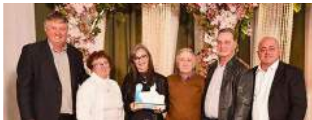
2º Garoto Indústria de Confecções Ltda