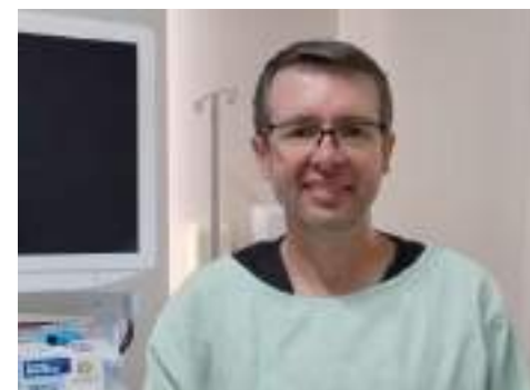
Dr. Anderson Fucks