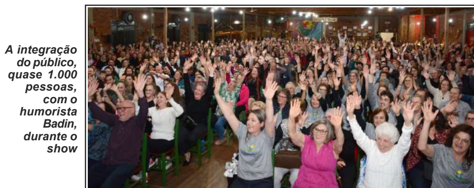
A integração do público, quase 1.000 pessoas, com o humorista Badin, durante o show