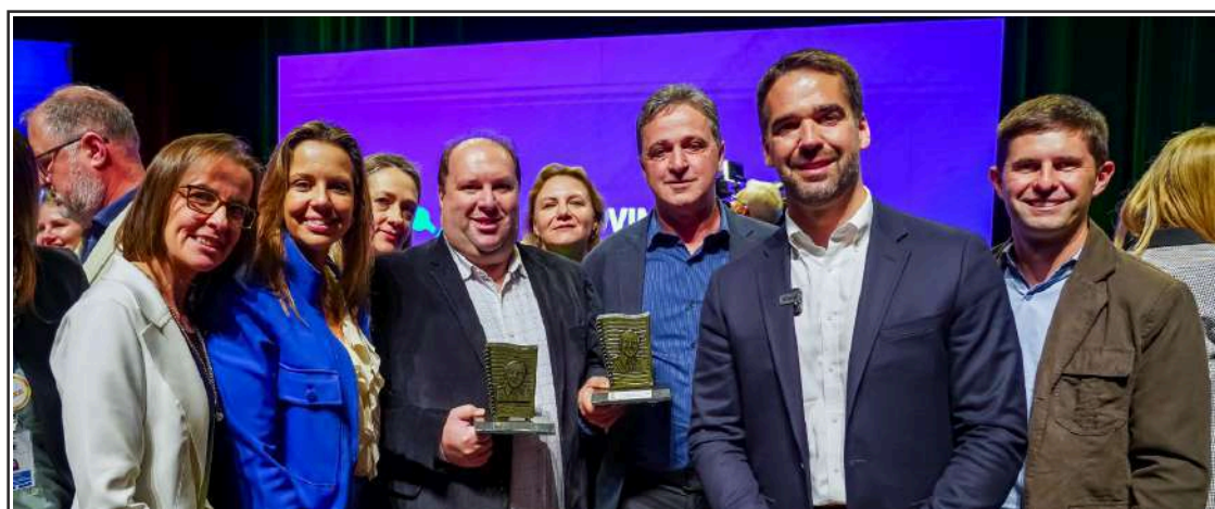
Ainda sobre a solenidade ocorrida na quarta-feira (18) na Assembleia Legislativa, quando da premiação do Troféu Educacional Leonel de Moura Brizola 2023, registrado acima, a foto da delegação do executivo de Ipiranga do Sul com a deputada Delegada Nadine Farias Anflor (PSDB) e o governador Eduardo Leite (PSDB)

# De igual modo estiveram com o ministro do Esporte, André Fufuca, e além da feira trataram de outras demandas da comunidade, e conversaram com deputados com atuação na região.