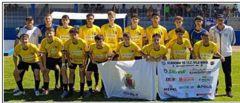
Equipe sub 15 terá quatro jogos em casa

No último sábado (14), a equipe sub 15 da Academia de Futebol TG, de Getúlio Vargas, foi até a cidade de Júlio de Castilhos onde enfrentou a equipe do Macléres, perdendo pelo placar de 3 a 1. A partida foi válida pelo Gauchão da Noligafi.