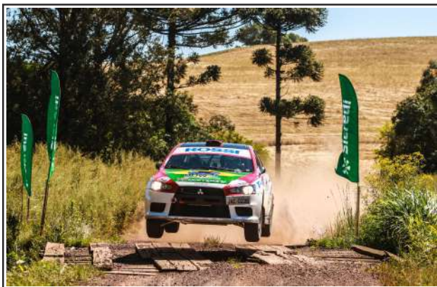
Prova de Ipiranga do Sul foi a mais rápida da competição

O Gaúcho de Rally terá mais duas provas pela frente: Severiano de Almeida em novembro e Marcelino Ramos em dezembro.