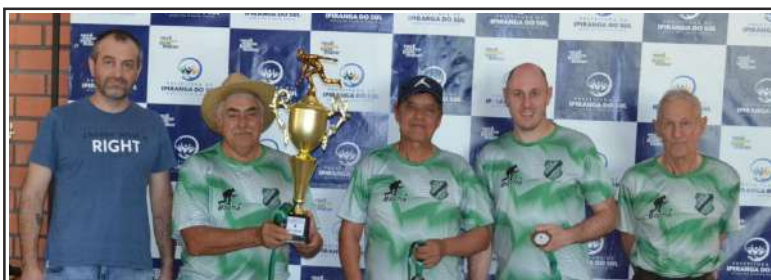
3º lugar, São João C (acima) e 4º lugar, São João A (abaixo)