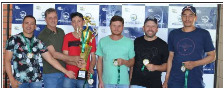
1º lugar, Alto Alegre (acima) e 2º lugar, Siqueira Campos A (abaixo)

A Comunidade de Siqueira Campos sediou a final do 8º Campeonato Municipal de Bochas de Ipiranga do Sul. Foi no último sábado (21). A equipe de Alto Alegre conquistou o título de campeã da competição. Participaram os desportistas das comunidades, autoridades municipais, entre elas, o prefeito Marco Antonio Sana e o vice-prefeito Fabiano Luiz Klein, secretários e servidores municipais. Os atletas foram contemplados com um almoço oferecido pelo governo municipal.