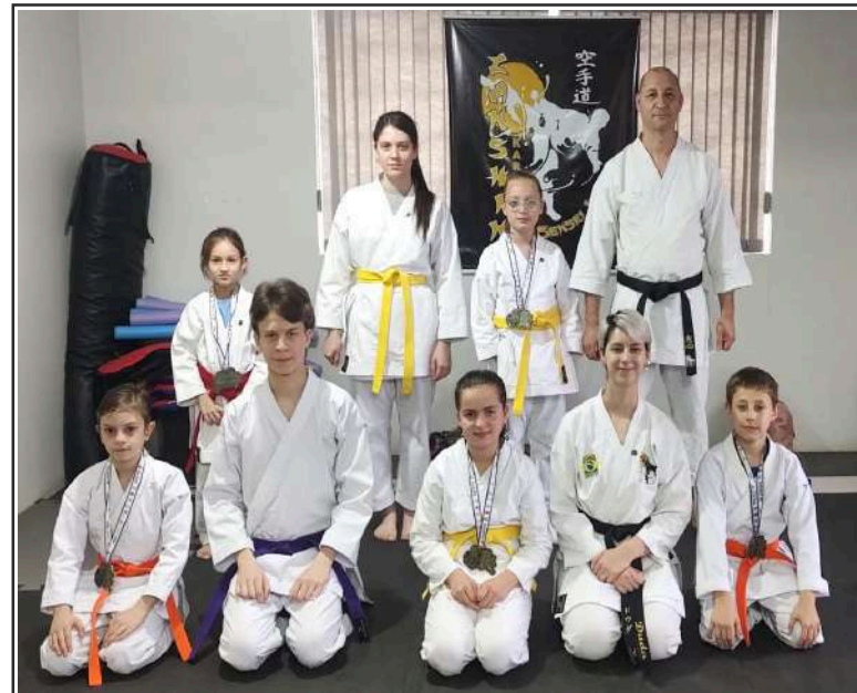
Atletas que se destacaram na competição em Marau