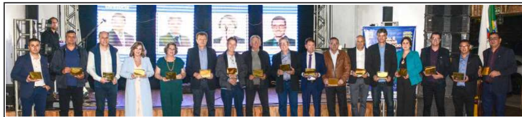
Os ex-presidentes da CDL com suas placas alusivas ao cinquentenário da entidade

Após o jantar, o baile foi animado pelo grupo Só Alegria.