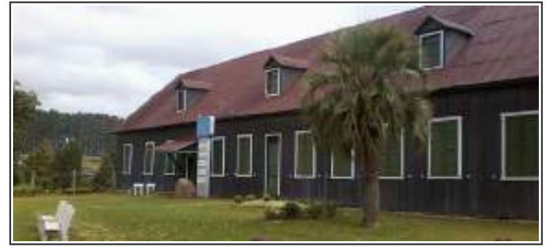
Evento em memória do pioneiro Hospital Israelita Leonardo Cohen

A Jornada será palco para palestrantes brasileiros em atuação nos Estados Unidos, em Israel, em São Paulo, Paraná e Rio Grande do Sul, em uma troca de experiências e