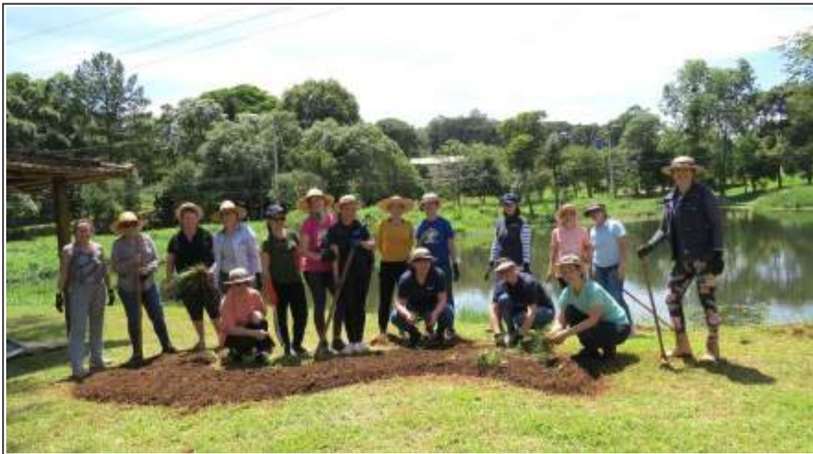
Capacitação faz parte do projeto Jardins do Norte Gaúcho

A capacitação dos extensionistas visa a potencialização do trabalho na área de paisagismo e jardinagem, para desenvolver práticas de melhoria dos arredores das propriedades, aliadas ao turismo rural.