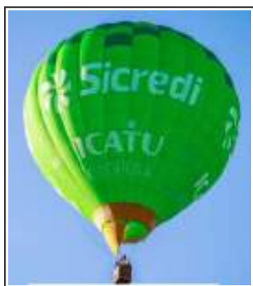
Passeio de balão será atração

Durante os três dias de evento, a instituição contará com três espaços, visando receber os visitantes com comodidade, fortalecendo o atendimento próximo e humano, além de apresentar as oportunidades e condições especiais de negócio. As iniciativas contemplam também passeio de balão, atividades recreativas para as crianças, experiência com realidade virtual