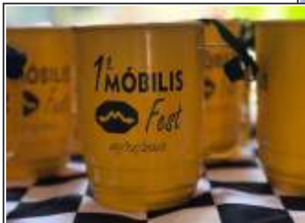
A Móbilis, academia de Getúlio Vargas, reuniu professores e alunos no último sábado, dia 02, para uma confraternização de fim de ano. A 1ª Móbilis Fest teve brincadeiras e brindes

Receba o abraço de sua família e dos amigos pelos 50 anos dedicados a amenizar a dor e o sofrimento dos pacientes, sempre com amor e generosidade.