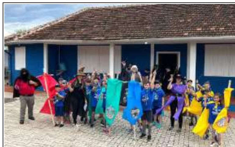
Imersão dos lobinhos na Escola de Magia e Bruxaria Hogwarts

A chuva no meio da tarde amenizou o calor e os trovões que se ouviram ao longe ambientaram o clima da escola, instalada no castelo. Após cada aluno receber sua varinha mágica tiveram início as atividades, que incluíram o jogo Coruja Correio, aula de misturas de poções, Petrificus Totalis - Jogo o prisioneiro de Askaban, Vingardium Leviosa, Pomo de Ouro, Aula de Feitiços, entre outros. Depois do jantar, servido no refeitório da escola de Hogwarts (sede