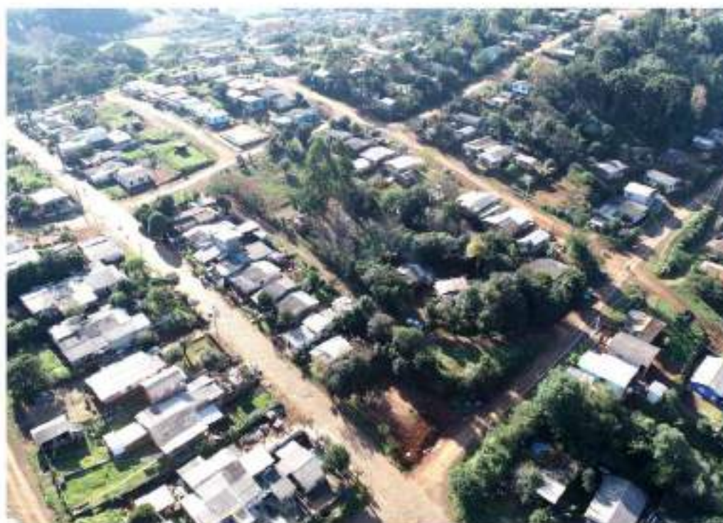
Área em que está sendo realizado o REURB

O município fará o estudo social das famílias que serão beneficiadas pela modalidade REURB de Interesse Social (REURB-S), que é a regularização fundiária aplicável aos núcleos urbanos ocupados por população de baixa renda (renda familiar de até cinco salários-mínimos vigentes).