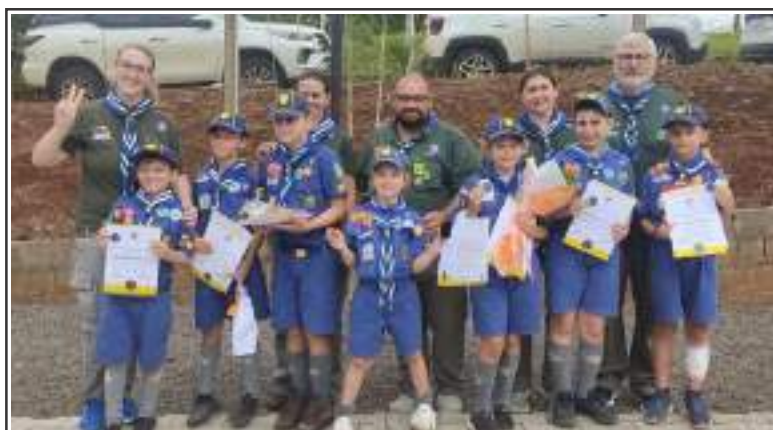
Os sete lobinhos que conquistaram o Cruzeiro do Sul, junto com os Velhos Lobos

Neste final de semana, as três patrulhas da Tropa Escoteira vão acampar numa propriedade do Distrito de Souza Ramos. A atividade também marca o encerramento do ano de 2023 e o período de férias se estende até o final de fevereiro. De acordo com os dirigentes da unidade escoteira local, a retomada das atividades estão programadas para o primeiro sábado de março.