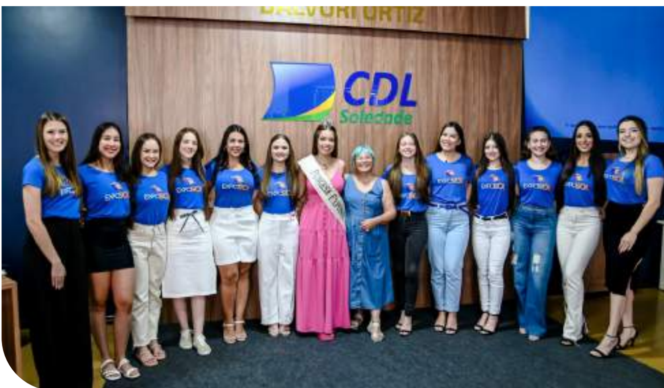
Candidatas à Corte da maior feira de Soledade