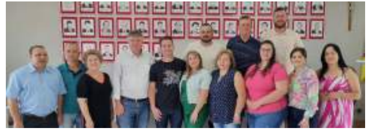
As conselheiras tutelares eleitas com as autoridades, na posse