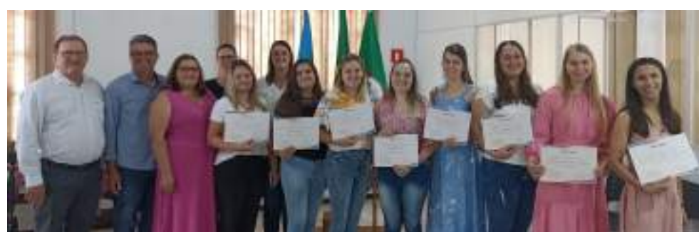
Conselheiros tutelares de Floriano Peixoto com autoridades