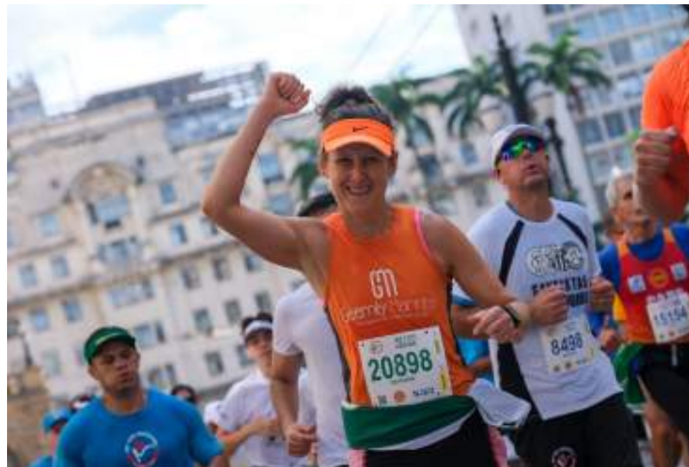
Sonho de criança é concretizado aos 42 anos de idade