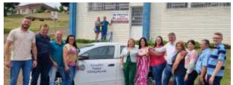
A nova sede do Conselho Tutelar fica no Centro Administrativo