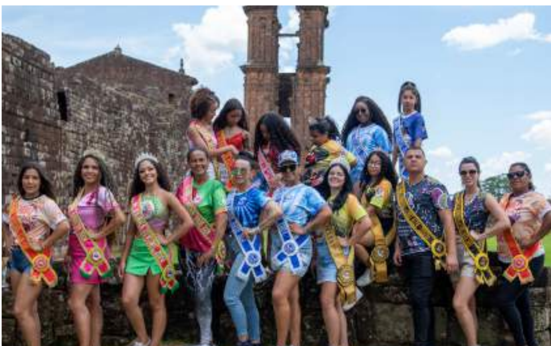
Programação com as candidatas incluiu passeio às Ruínas de São Miguel, Patrimônio da Humanidade, e palestras sobre etiqueta

Cruz Alta escolhe Corte Municipal do Carnaval Fora de Época