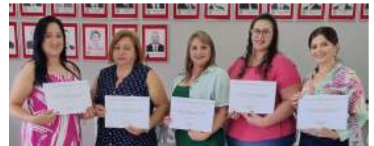
As conselheiras tutelares diplomadas já estão atuando