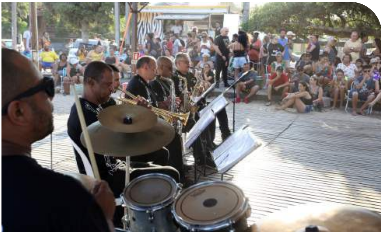
Festival é um dos maiores da área na América Latina

Entre os jovens selecionados para os cursos de aperfeiçoamento musical do 12º Festival Internacional Sesc de Música estão músicos de Santa Maria, Santiago, Passo Fundo, Cruz Alta e Bagé. De SM são 10 alunos, de Santiago, dois, que