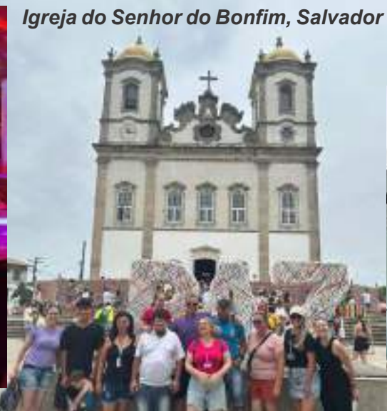
Igreja do Senhor do Bonfim, Salvador