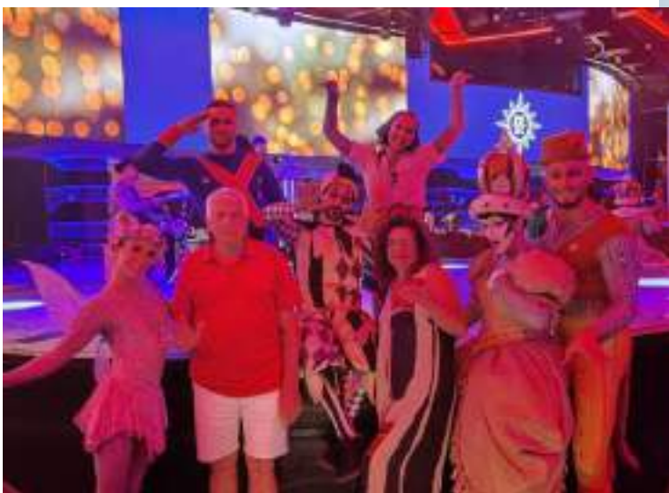
O grupo ficou encantado com as apresentações teatrais que foram magníficas de lindas