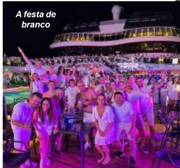
A festa de branco

De 20 a 27 de janeiro, o transatlântico MSC Grandiosa foi a casa de um grupo de amigos de nossa cidade e da região, que fizeram um bellissimo passeio por mar e terra. O cruzeiro partiu de Santos (SP), com paradas em Búzios (RJ), Salvador (BA) e Maceió (AL), retornando a Santos. Agradeço aos amigos que me enviaram fotos para esse registro especial.