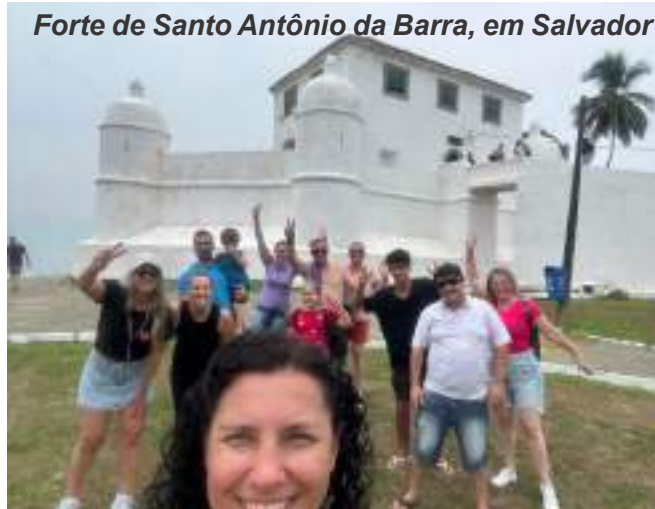
Forte de Santo Antônio da Barra, em Salvador