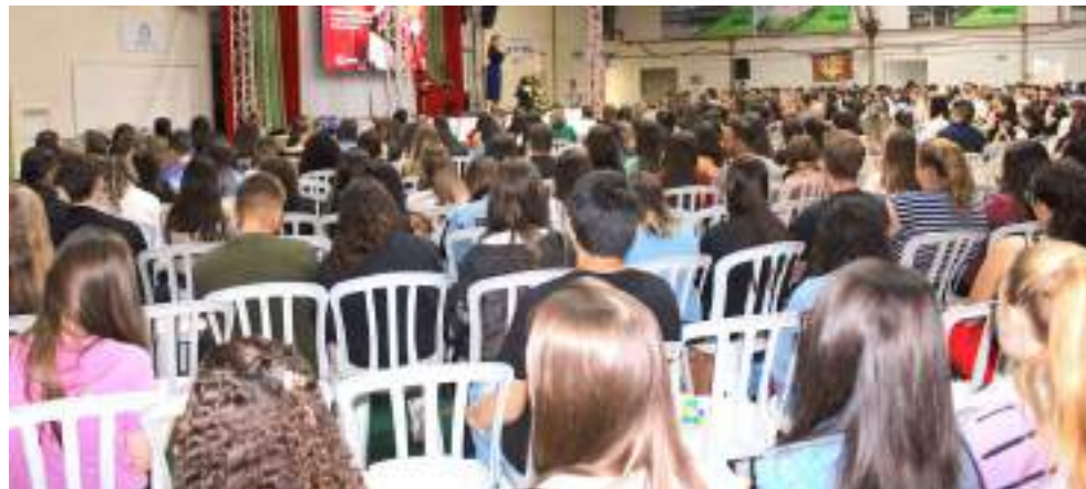
A comunidade acadêmica lotou o ginásio da instituição

Como parte do reconhecimento do mérito acadêmico, a noite também foi marcada pela entrega da Bolsa Mérito aos estudantes destaques do último semestre. Essa honraria destaca não apenas o desempenho acadêmico excepcional, mas também pressupõe