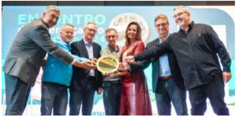
Sindicato Rural de Carazinho, Farsul e Cotrijal homenageiam a parlamentar