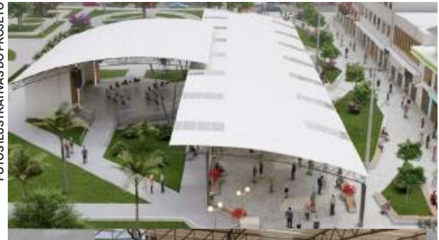
FOTOS ILUSTRATIVAS DO PROJETO

A audiência pública aprovou o projeto de requalificação do cal-