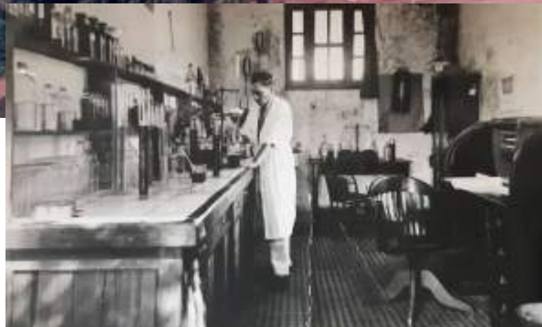
Cervejeiro na produção da bebida