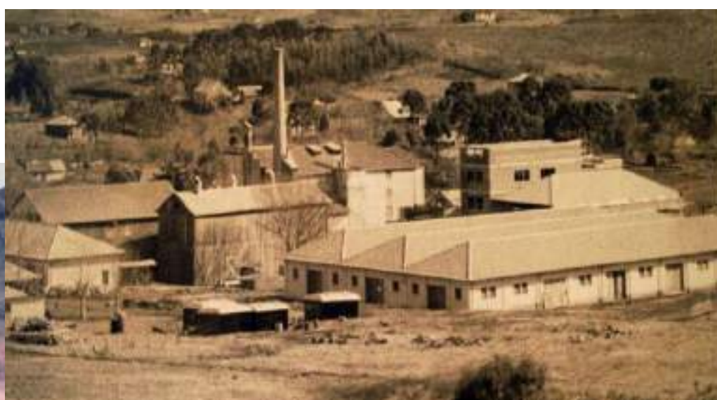
Acima, foto da Cervejaria Bramatti, a precursora da Serramalte, na década de 1960

Evento inicia nesta sexta-feira (15) e segue até domingo (17), consolidando Getúlio Vargas como a Terra da Cerveja. Confira a programação completa na página 10; o especial que preparamos sobre a trajetória da cerveja no RS e em Getúlio Vargas; e o mapa do evento na página 4.