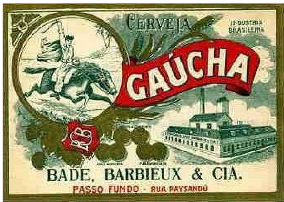
Rótulo da cerveja Gaúcha, de Passo Fundo

Como era comum na época, as garrafas de cervejas eram acondicionadas em caixa de madeira e para o transporte mais longo o vasilhame era empalhado com palha de cevada. O grosso da produção de cervejas e refrigerantes da Serrana era realizado pela ferrovia. O complexo industrial foi adquirido pela Cervejaria Brahma, que também comprou a Continental, em Porto Alegre.