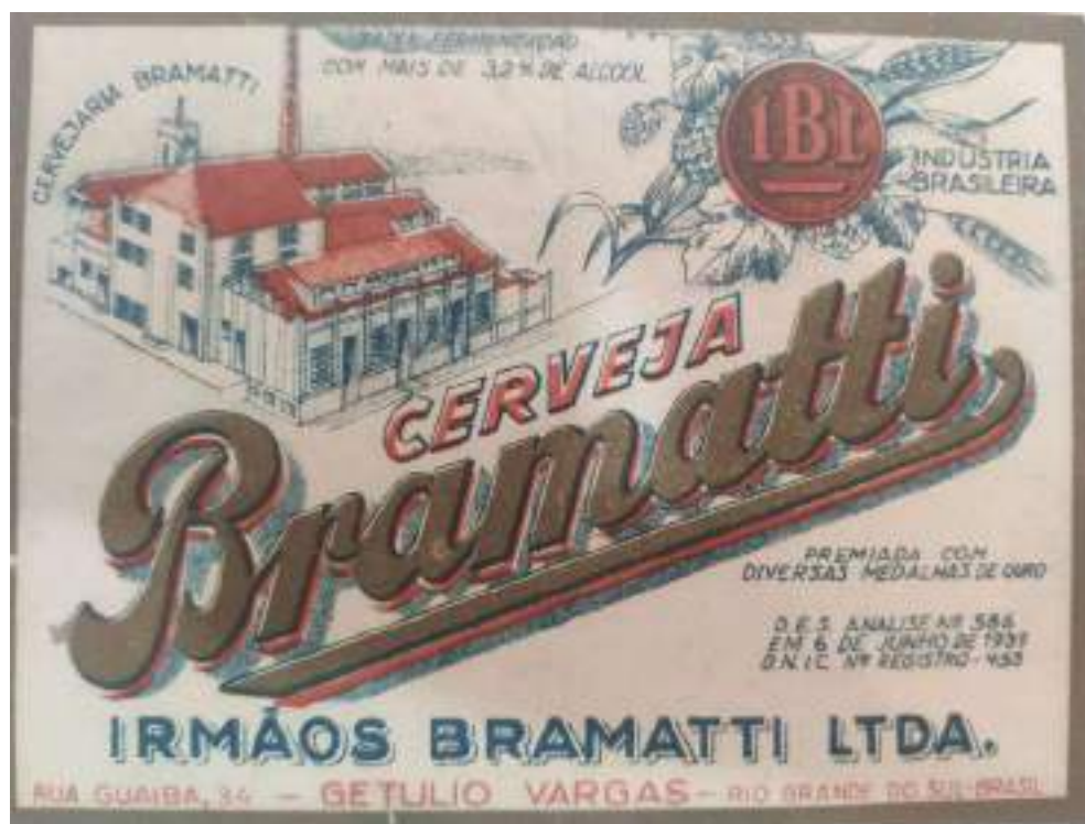
Rótulo da cerveja Bramatti & Filhos, de Getúlio Vargas