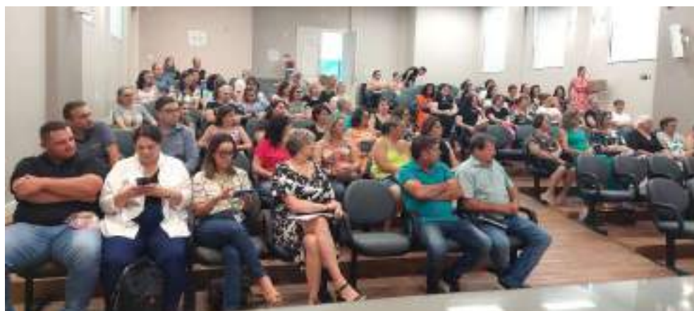
Evento aconteceu no auditório do Sindicato Rural de Getúlio Vargas