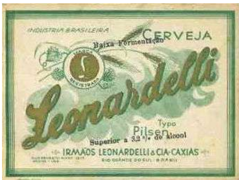
Rótulo da cerveja Leonardelli & Irmãos, de Caxias do Sul

Das treze indústrias existentes em Porto Alegre na passagem do século XIX para o XX, somente seis ainda estavam em atividade no ano de 1915. Neste período, Caxias do Sul contava com duas empresas do ramo: Leonardelli & Cia, produzindo cerveja, e Leonardelli & Irmão, produzindo cerveja, gasosa e água de soda.