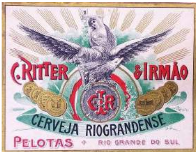
Rótulo da Cervejaria Riograndense C. Ritter & Irmão, de Pelotas

As regiões de colonização alemã, como Novo Hamburgo, Santa Cruz do Sul e Dois Irmãos, também contavam com indústrias locais. De igual modo, as cidades de Rio Grande e Jaguarão.