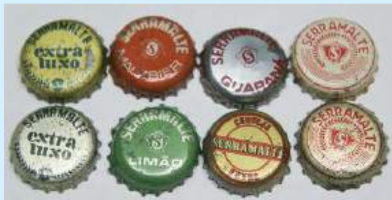
Tampinhas de vários produtos da marca Serramalte.

Para fugir da dependência, a Cervejaria Continental passou a incentivar a produção de cevada cervejeira. Além da distribuição de sementes, a empresa garante a aquisição do grão. A área cultivada em 1934, o mesmo ano da emancipação de Getúlio Vargas, alcançou 8.480 hectares no RS. Com a matéria-prima necessária, a Continental inovou ao instalar uma maltaria, a primeira de outras que seriam implantadas. A iniciativa incrementou a produção da bebida e diminuiu os custos de produção.