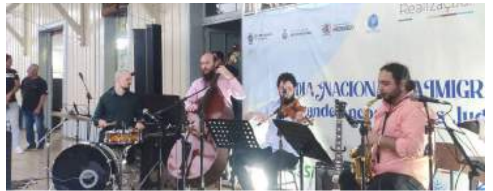
Momento cultural em Erebangó, com a Banda Klezmer Knaidel