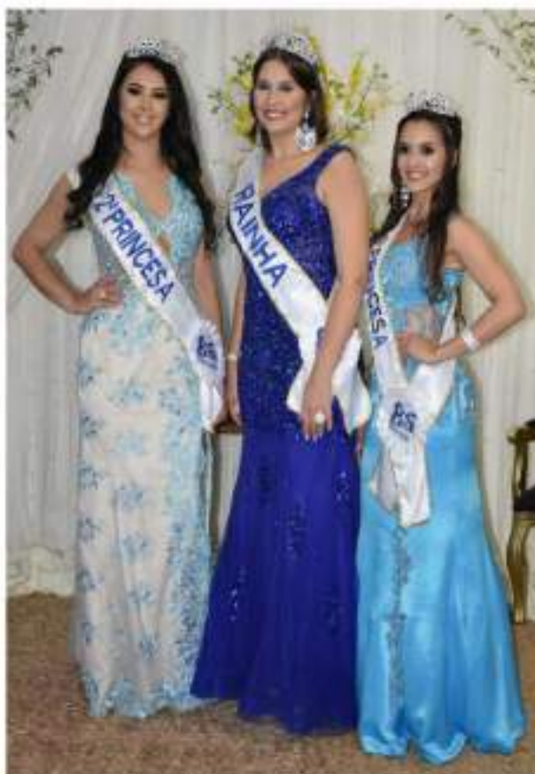
Corte dos 85 Anos do Município de Getúlio Vargas

As candidatas ao título de Soberanas do Município de Getúlio Vargas e Expo Getúlio Vargas 2024 serão apre-