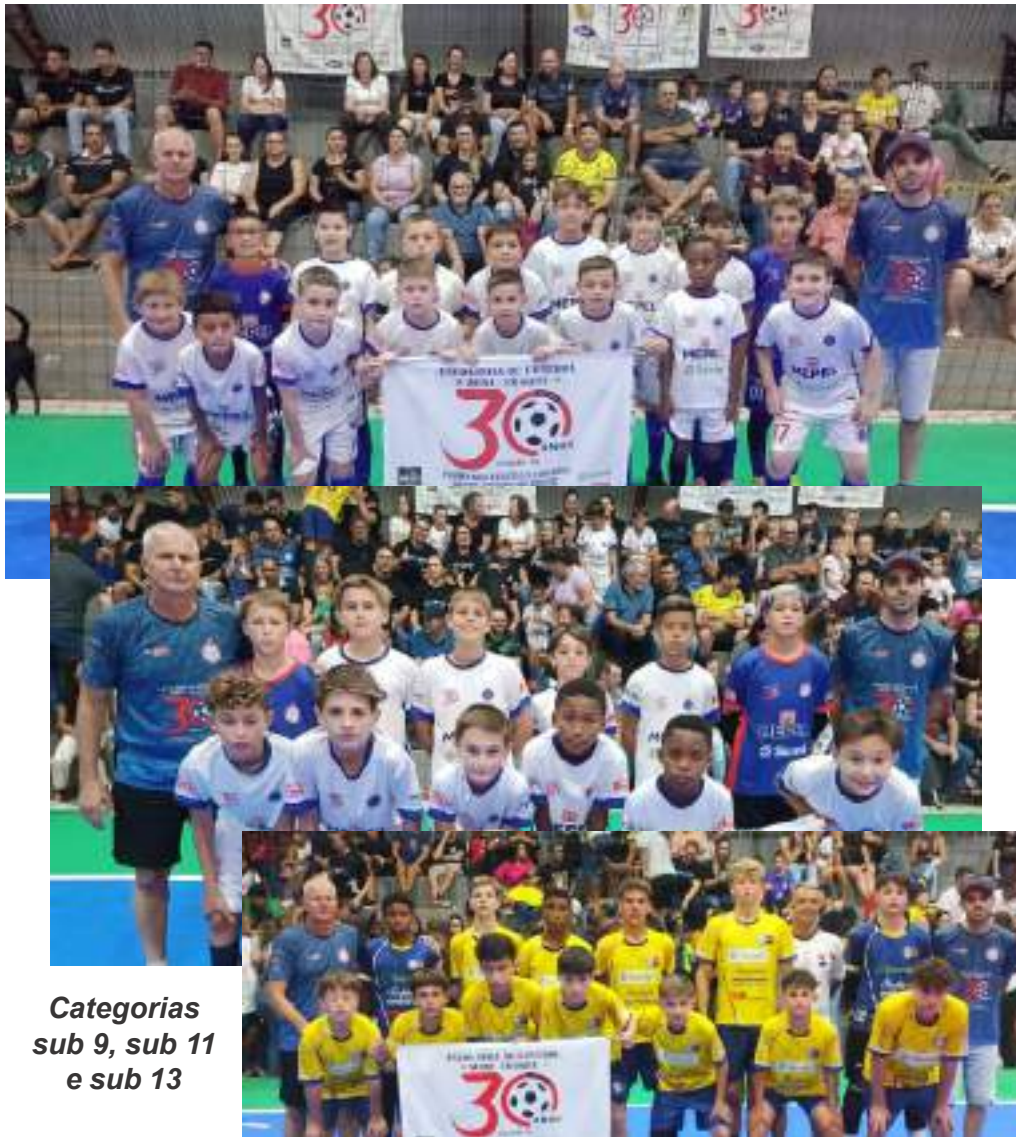
Categorias sub 9, sub 11 e sub 13