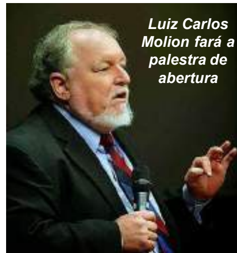
Luiz Carlos Molion fará a palestra de abertura

Confira a programação e os palestrantes do evento.