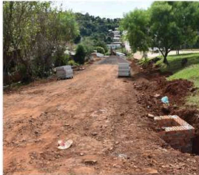
Rua Sem Denominação

Rua José Galina (Rio Toldo), 292 m 2 , no valor de R$ 212.622,54