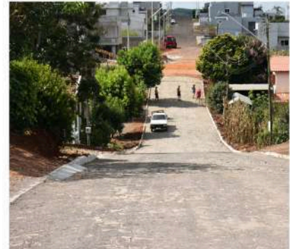
Rua Constante Richetti