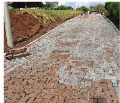
Rua Monsenhor Farinon