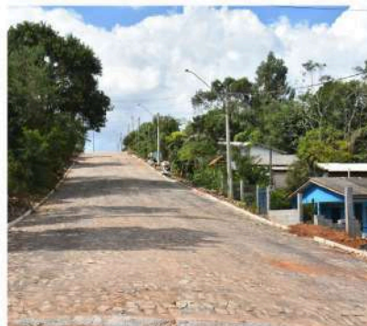
Rua Júlio de Castilhos