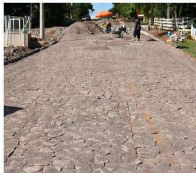
Rua José Galina