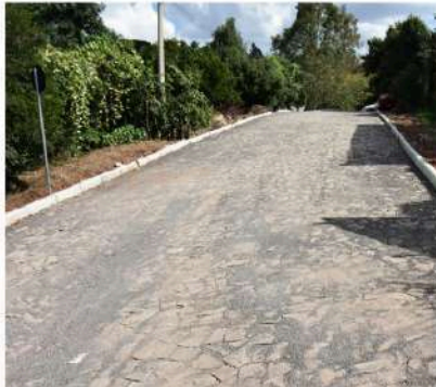
Rua Rodolfo Muller