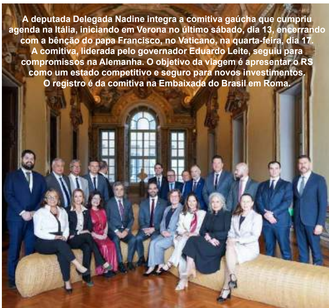
A deputada Delegada Nadine integra a comitiva gaúcha que cumpriu agenda na Itália, iniciando em Verona no último sábado, dia 13, encerrando com a bênção do papa Francisco, no Vaticano, na quarta-feira, dia 17. A comitiva, liderada pelo governador Eduardo Leite, seguiu para compromissos na Alemanha. O objetivo da viagem é apresentar o RS como um estado competitivo e seguro para novos investimentos. O registro é da comitiva na Embaixada do Brasil em Roma.

A rainha e as duas princesas eleitas também irão representar a Expo Getúlio Vargas 2024, que acontecerá em outubro. O prêmio da rainha será R$ 3 mil e das princesas, R$ 1,5 mil cada.