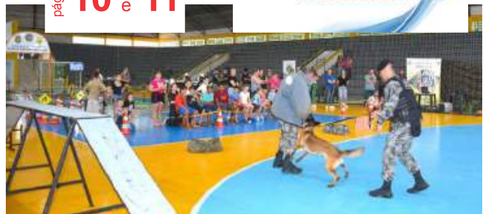
Os cães policiais sempre chamam a atenção. Não foi diferente na Exposição da Segurança Pública em Ipiranga do Sul, no último sábado

• Concurso Soberanas dos 90 anos e Expo Getúlio Vargas 2024 recebe inscrições até 07 de maio