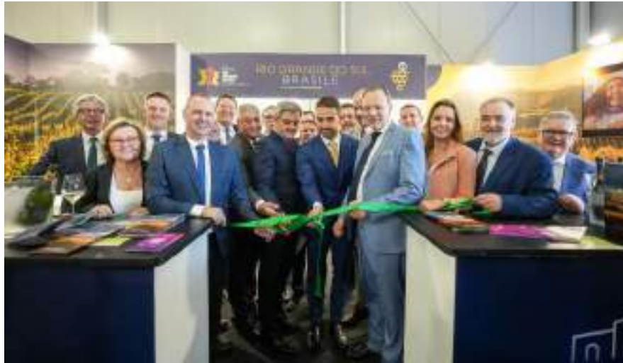
A comitiva gaúcha participou da inauguração do estande do Rio Grande do Sul na 56ª Vinitaly, em Verona

Em Roma, a comitiva liderada pelo governador Eduardo Leite esteve, na Embaixada do Brasil, com representantes da Sace, da Simest e do Intesa Sanpaolo, para apresentar projetos do governo nas áreas de infraestrutura, saneamento básico, mobilidade, segurança, lazer e em áreas sociais. Dentre os destaques de possíveis investimentos estão a concessão de rodovias, o saneamento