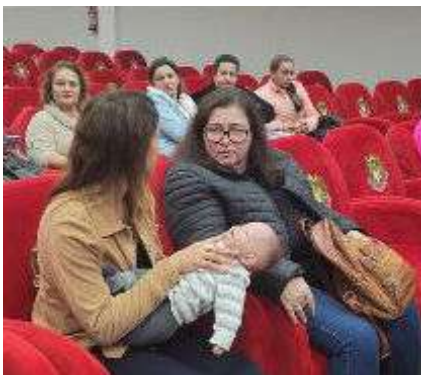
Profissionais de escolas e creches municipais de diversos municípios do Alto Uruguai participam da formação

A lei foi inspirada por uma tragédia que ocorreu em 2017, quando Lucas Begalli Zamora, de 10 anos, faleceu após engasgar durante um passeio escolar, devido à falta de preparo dos adultos presentes para realizar manobras de desengasgo e primeiros socorros.