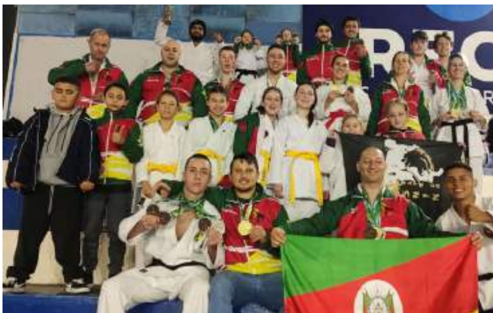
Equipe gaúcha fica em 3º lugar no quadro de medalhas