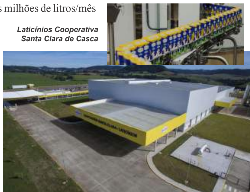
Laticínios Cooperativa Santa Clara de Casca

A Santa Clara conta com três plantas de processamento do leite: Carlos Barbosa, Casca e Getúlio Vargas. A localizada em Casca é a