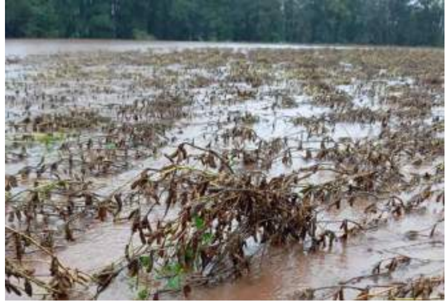
O impacto das enchentes no Rio Grande do Sul será tema de palestra