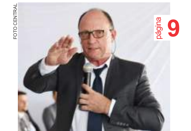
Sertão - Prefeito Homero Fochesatto (PL)