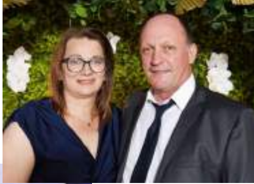
Prefeito de Sertão, Homero Fochesatto, com a primeira-dama Liamar Dallanora