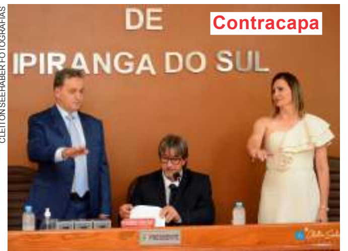
Ipiranga do Sul - Prefeito Marco Sana (União) e vice-prefeita Luciana Folle (PP)