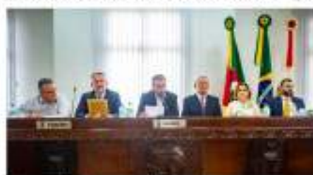
Mesa da Solenidade de Posse