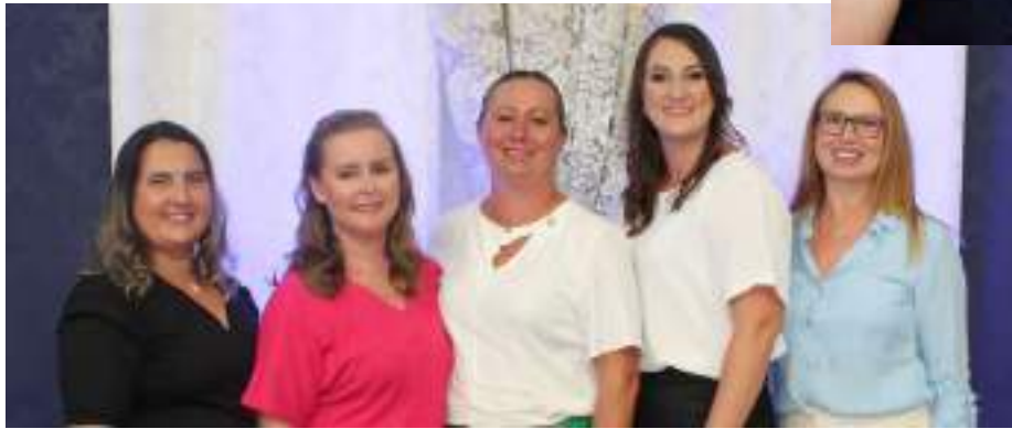
Em Floriano Peixoto, as mulheres continuam sendo a maioria na Câmara de Vereadores. E também empossou a sua primeira vice-prefeita