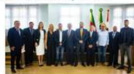
Prefeito, vice-prefeito e vereadores eleitos tomam posse