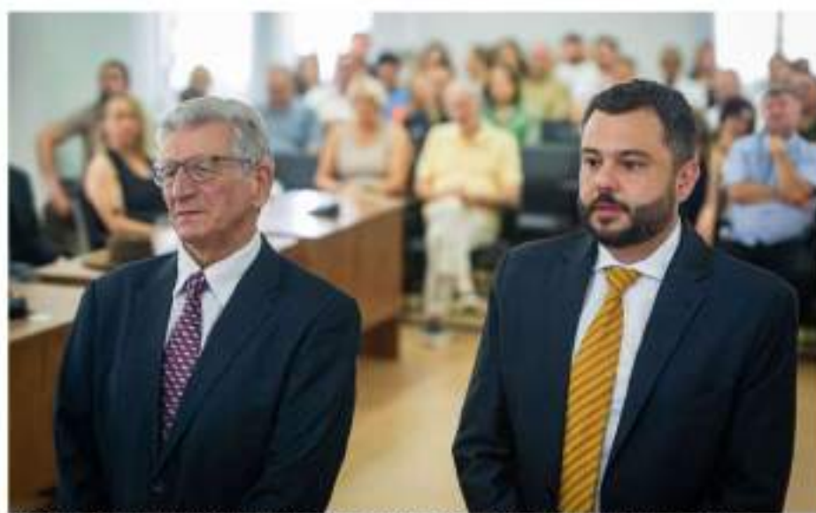
Prefeito Pedro Paulo Prezzotto e vice-prefeito Dinarte Afonso Tagliari Farias