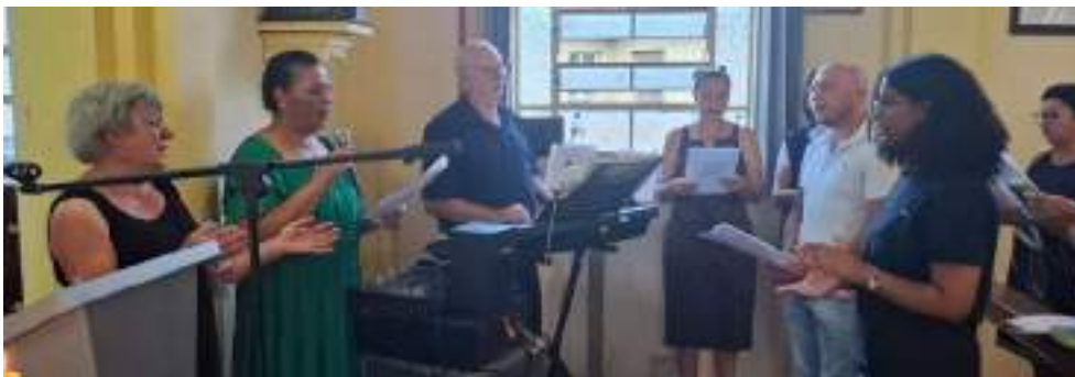
Equipe responsável pela liturgia da missa