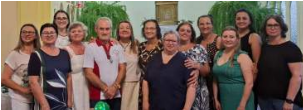
Ex-colaboradores e alguns dos membros ativos no HSR